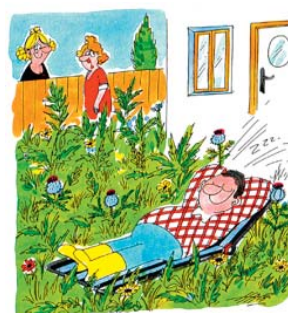
„MEIN MANN WÜLL IN DAS BIOLOGISCHE GLEICHGELICHT NICHT EINGREIFEN.“

Fragt der Deutschlehrer seine Schüler: "Wer kann mir sagen, ob es der Monitor, oder das Monitor heißt?"